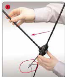
Ouvrir les bras de la structure