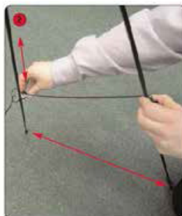
Ouvrir les pieds d'appui pour former un trépied stable